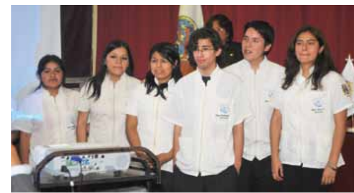
• Estudiantes que hicieron su internado en el Consultorio Psicológico.