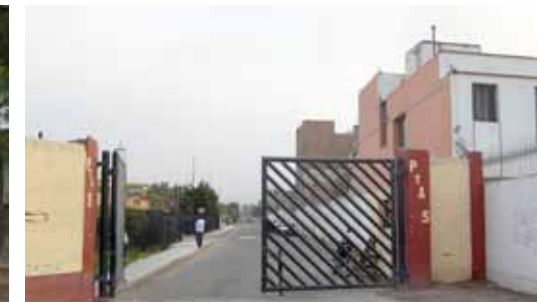
• Puerta de la Av. Óscar R. Benavides, (ex Colonial).