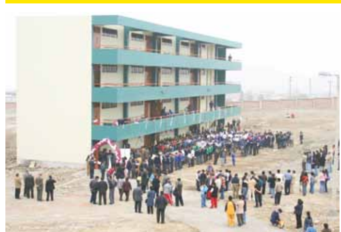
• Dictamen aprobado por Comisión de Educación del Congreso respeta la propiedad de la UNMSM ubicada en SJL.

Resaltó el caso de la Biblioteca-Museo Temple Radicati. “Aquí tenemos en proceso la aprobación de los proyectos que permitirán realizar los trabajos de infraestructura y acondicionamiento para presentar a la comunidad la colección completa de 29 quipus; asimismo, posee una interesante y completa biblioteca con doce mil volúmenes de libros de historia, geografía, derecho, economía, educación, arte, religión, sociología, arqueología, entre otros”, refirió sobre esta sede sanmarquina ubicada en San Isidro. Este fue un resumen del recuento general hecho por el Rector.