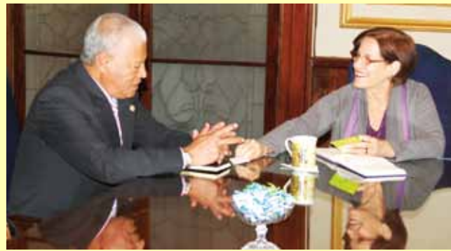
• Rector Pedro Cotillo y alcaldesa Susana Villarán en reunión efectuada el 27 de junio, en el Palacio Municipal.

Una de las primeras acciones fue encontrar una solución definitiva al problema del intercambio vial de las avenidas Venezuela y Universitaria, heredado de la gestión anterior rectoral.