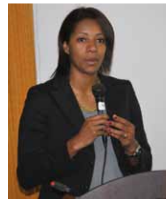
• Congresista Leyla Chihuán.

Se vienen importantes modificaciones en el plan de estudio de la EAP de Educación Física, perteneciente a la Facultad de Educación. Docentes, egresados, estudiantes de esta Escuela y es-