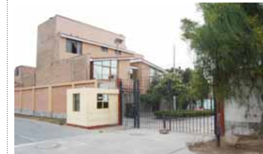
• Puerta de Urb. San Joaquín.