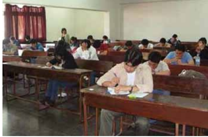
Alumnos sanfernandinos rindiendo el ENAM 2011.

“No hay una fórmula mágica para lograr un primer puesto o un buen resultado. Lo único por hacer es poner el lugar donde realizar su Servicio Ru-