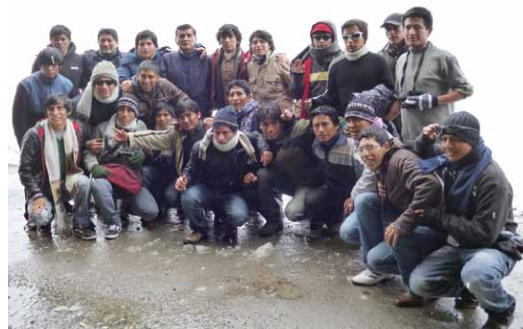
Alumnos de la Residencia Julio C. Tello en el Nevado de Pastoruri.

En el marco del 58 aniversario de la Residencia Universitaria, celebrado en octubre, los alumnos de las sedes de la Ciudad Universitaria, en Lima, y de Julio C. Tello, en La Victoria, disfrutaron de un paseo de confraternidad, a la provincia de Chanchamayo (Junín) y a la ciudad de Huaraz (Áncash), respectivamente, en diciembre de 2011.