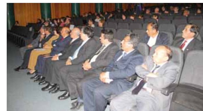
• Decanos e investigadores asistieron a la ceremonia.

Los profesores pertenecen a las Facultades de Ciencias Biológicas; Ciencias Físicas; Biología