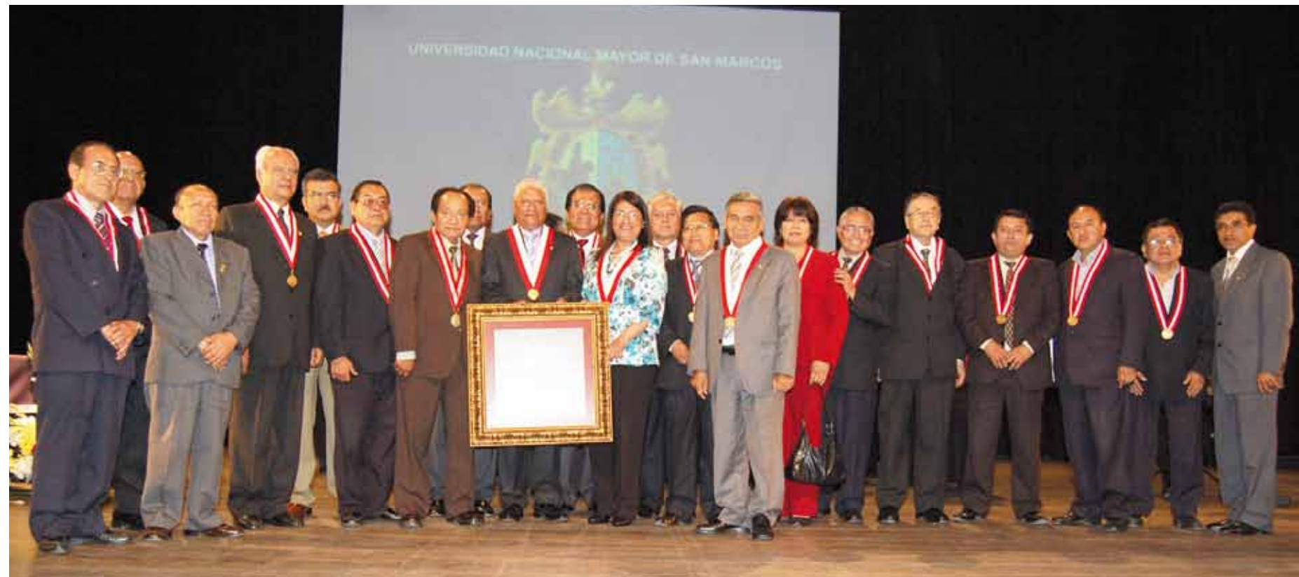
• Autoridades posan junto al certificado de Acreditación Internacional Institucional.