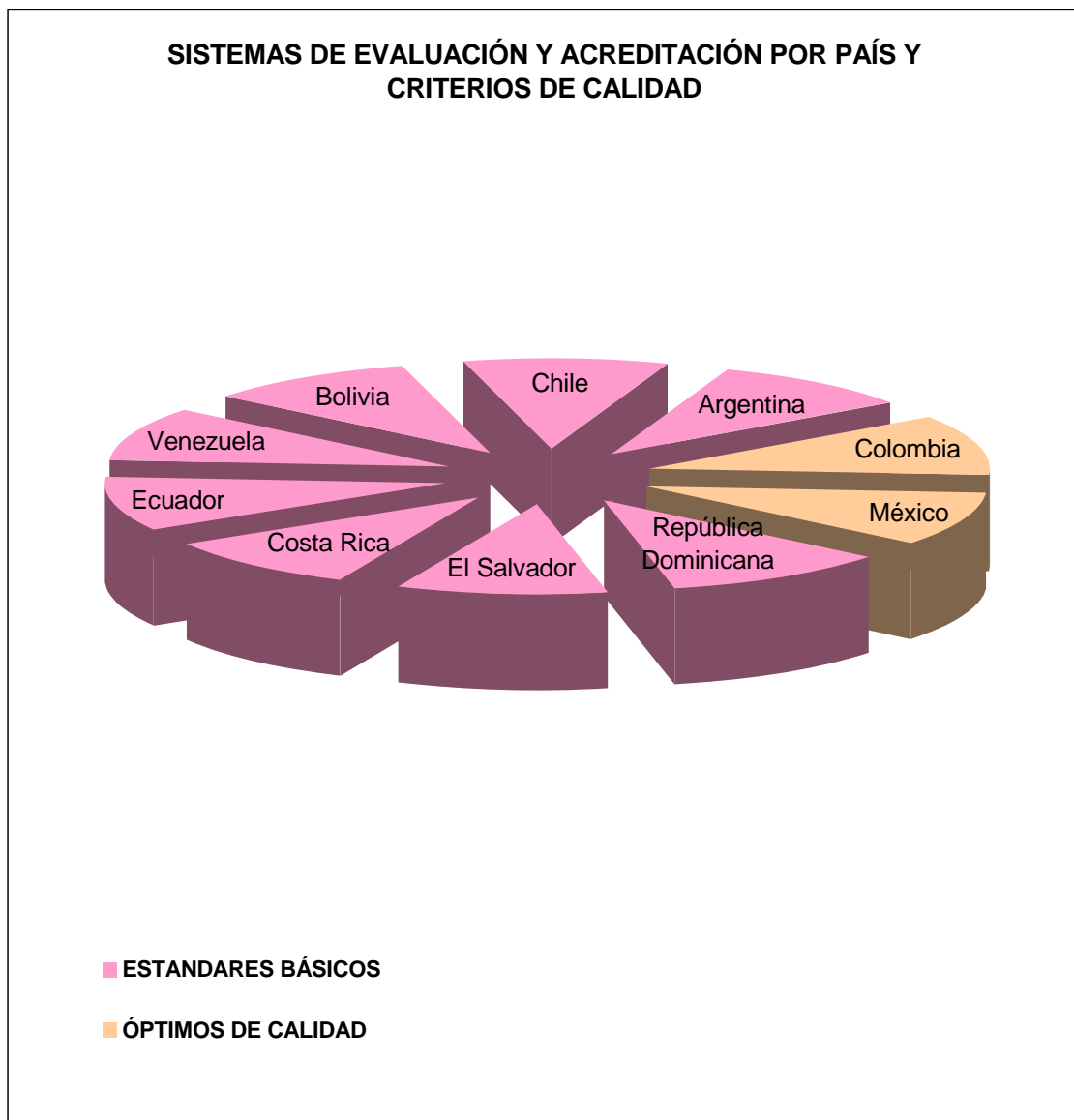
Gráfico N.º 1

Solamente son los sistemas de Colombia (artículo 53º) y México quienes trabajan con el criterio de los óptimos de calidad, certificando a las instituciones que logran cumplir los más altos requisitos de calidad, los cuales han sido definidos y preestablecidos por los sistemas de evaluación y acreditación de acuerdo a las recomendaciones realizadas por especialistas en los temas de educación superior, por convenciones entre los representantes de las diversas partes, y las exigencias de los organismos internacionales y del sistema mundo.