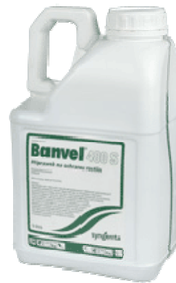
Foto N° 1 Banvel, herbicida clorofenólico (ácido 2-metil-3,6 diclorobenzoico)

Los herbicidas clorofenólicos, en ocasiones se mezclan con fertilizantes comerciales para controlar el crecimiento de hierbas de hoja ancha, a la vez que se adicionan nutrientes al suelo.