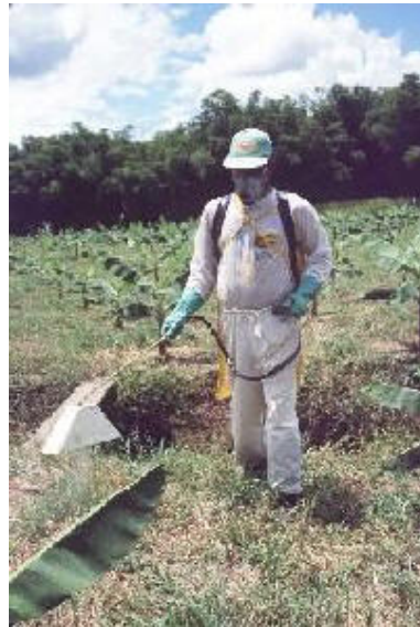
Foto N° 2 Trabajador aplicando una solución de Dicamba

ácido 2,4-diclorofenoxyacético (2,4-D), ácido 2,4-diclorofenoxypropiónico, (2,4-DP) dicloroprop, ácido 2,4-diclorofenoxybutírico (2,4-DB), ácido 2,4,5-triclorofenoxyacético, (2,4,5-T), MCPA, MCPB, mecorprop (MCP), ácido 2-metil-3, 6-diclorobenzoico (Banvel, Dicamba).