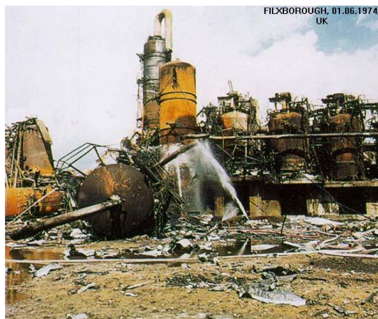
Foto N° 3 Explosión de la planta química NYPRO en Flixborough, Inglaterra Ocurrido el 01-06-1974

Esto no significa que el investigador deba soslayar los actos erróneos o irresponsables que sean de su conocimiento, ni solapar a los causantes de cualquier acción peligrosa que haya contribuido al accidente, si los identifica. Sin embargo, su principal objetivo es recopilar datos sobre los hechos y analizarlos de manera objetiva, para que la investigación y el informe que surja de ella contribuyan realmente a evitar accidentes futuros.