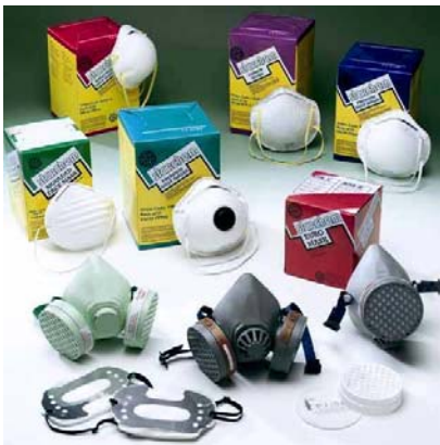
Foto N° 4 Mascarillas y respiradores

Las mascarillas son piezas faciales sencillas, ya que el material del que están elaboradas es el mismo agente retenedor, por lo cual no requieren de mantenimiento ni de otros elementos adicionales. Sin embargo, los niveles de protección son menores. Se usan básicamente para materiales particulados (polvos y neblinas). Algunas compañías han desarrollado mascarillas que adicionalmente protegen contra ciertos productos específicos; sin embargo, es necesario evaluar muy bien la conveniencia de su uso, anteponiendo la salud y la vida del trabajador, al precio del producto.