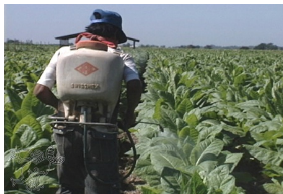
Foto N° 2 Aplicación de plaguicidas químicos

Según el Convenio de Róterdam el comercio de productos químicos y de plaguicidas incluidos en la lista de Consentimiento Fundamentado Previo (CFP) requieren la aceptación del país importador (actualmente hay una lista de 39 sustancias), facilitando a los países en desarrollo poder decidir sobre los plaguicidas y productos químicos peligrosos que desean recibir y excluir los que no pueden manejar de forma segura. Los países productores tienen la responsabilidad de asegurar que ninguna exportación abandona su territorio cuando el país importador ha decidido no aceptar el producto químico o plaguicida en cuestión.