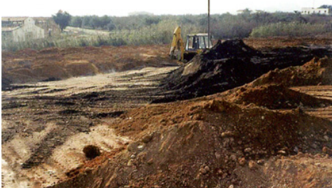
Foto N° 3 Tratamiento on site de suelo contaminado

Tratamiento ex situ (on site: a un lado del sitio): En este caso, el proceso se aplica cuando el suelo contaminado se excava y se traslada a un lado, a una celda de tratamiento.